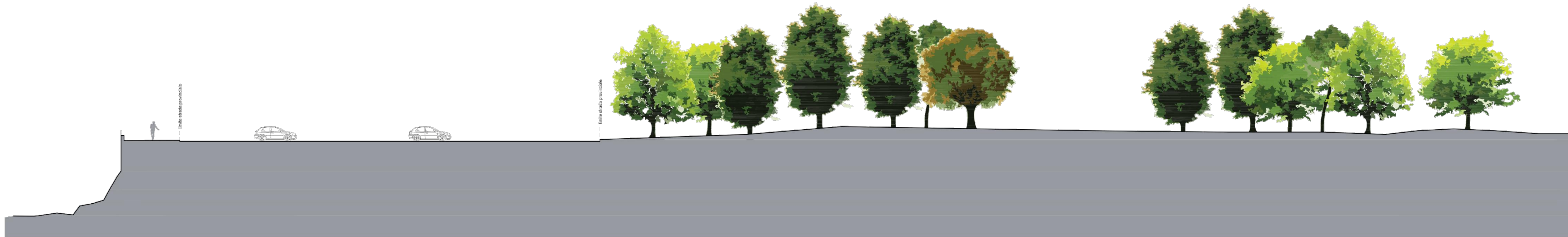
SEZIONE BB - stato di fatto - scala 1:200